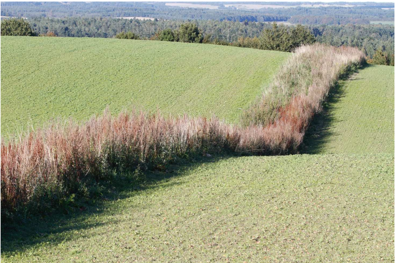
En insektvold tilsæt med tuedannede græsser tilgodeser ikke kun de jordrugende fugle, men også rovinsekter som er nyttedyr i marken.

Sørg for at lave klare og gerne skriftlige aftaler med lodsejeren, inden du går i gang. Ejeren af ejendommen kan have særlige ønsker der går udover lovens krav. Hvis jordens drift er bortforpagtet bør i også inddrage forpagteren og dennes planteavlskonsulent, da der i forbindelse med forskellige støttetilsagn, kan være særlige betingelser tilknyttet, som også natur- og vildtplejeren skal overholde, da det ellers kan resultere i krav om tilbagebetaling af landbrugsstøtte, og bøder mod landbrugeren.