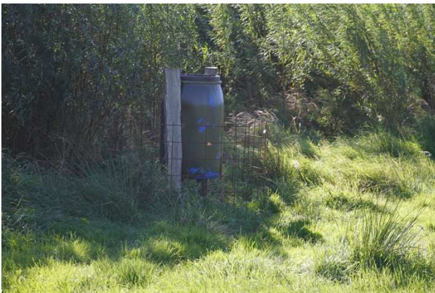
Fodertønde til fuglevildt. Det er en god idé at sikre, at hjortevildtet ikke kan komme til tønden. På dette billede er der brugt armeringsnet.

Landejendomme med økologitilsagn skal overholde en række generelle regler, som er beskrevet i NaturErhvervstyrelsens "Vejledning om økologisk jordbrugsproduktion". Når ejendomme er økologiske, skal økologireglerne også overholdes i de levende hegn og vildtremiserne. Derfor skal fodring af vildt ske efter økologireglerne, selvom der ikke fodres direkte på markerne.