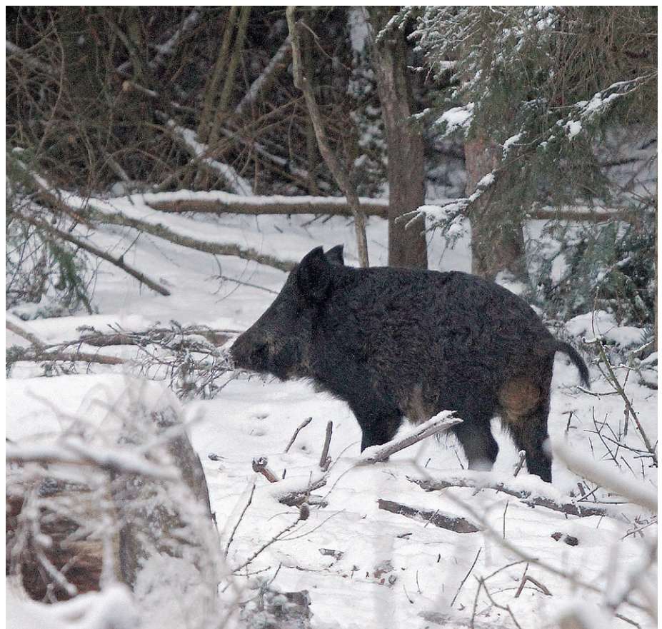
Tysklandsfarende danske jægere ved, at man mange steder skal være bevæbnet med blyfri riffelammunition.

Hvis vi accepterer, at forbuddet mod blyholdig riffelammunition på et eller andet tidspunkt også rammer Danmark, så står vi allerede nu i en bedre situation end i 1996. Lige nu har vi en enestående mulighed for at påvirke lovgiverne, så vi, når forbuddet træder i kraft, har en lovgivning, der passer til virkeligheden, og en virkelighed, der passer til jægerne. nvk@jaegerne.dk