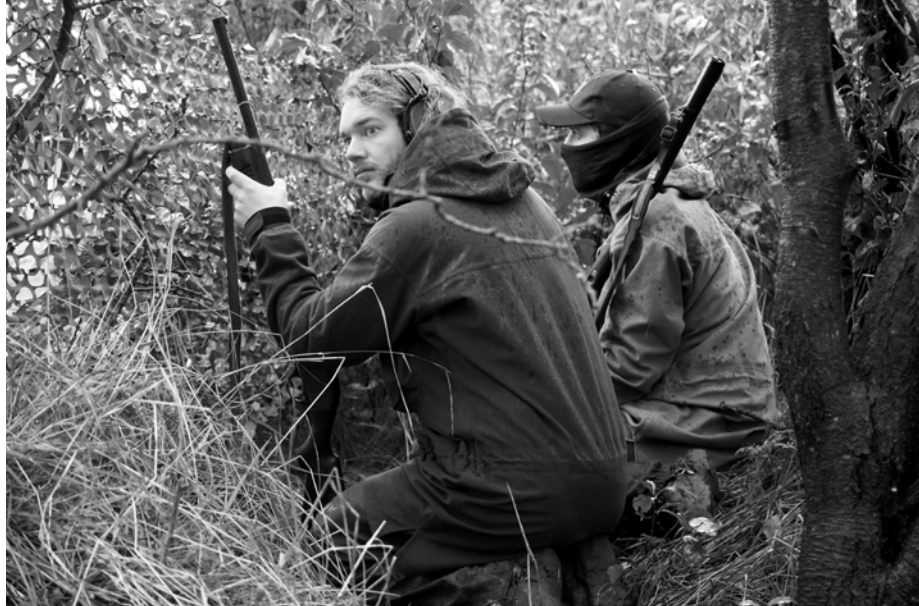
Det har stor betydning for jagten i Danmark, at jægerne har mulighed for at træne på landets skydebaner, inden de skal prøve kræfter med f.eks. som her trækjagt på ringduer. Den opgave tager de tre skydeudvalg og våbenudvalget meget alvorligt.

Vi vil fortælle om egne udvalg, politiske og faglige processer i forhold til nationale og internationale samarbejdspartnere og myndigheder samt bringe interview med centrale myndigheder og politikere på retsområdet.