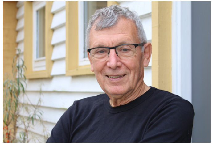
Svend Bichel, daværende præsident for Danmarks Naturfredningsforening.